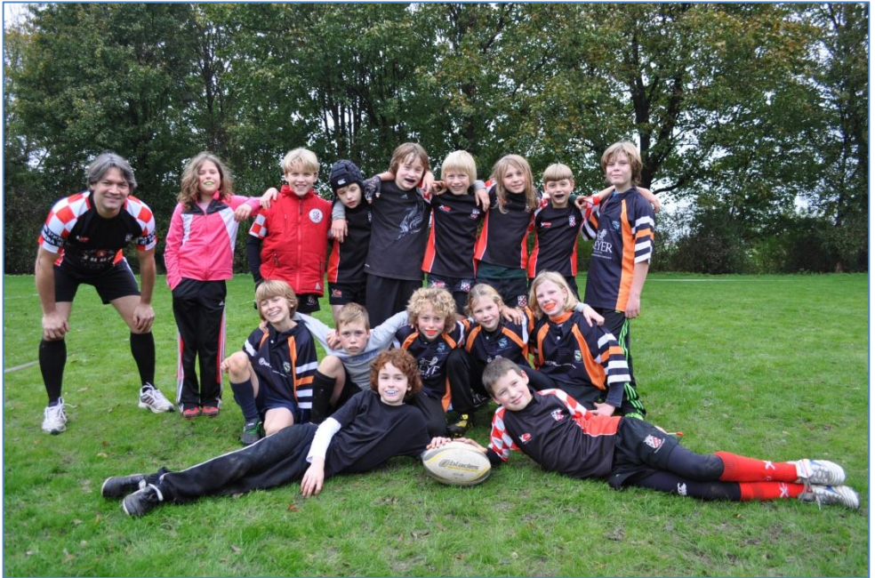
Brakkenoer BRC. Clusterteam Benjamins REL/BRC3