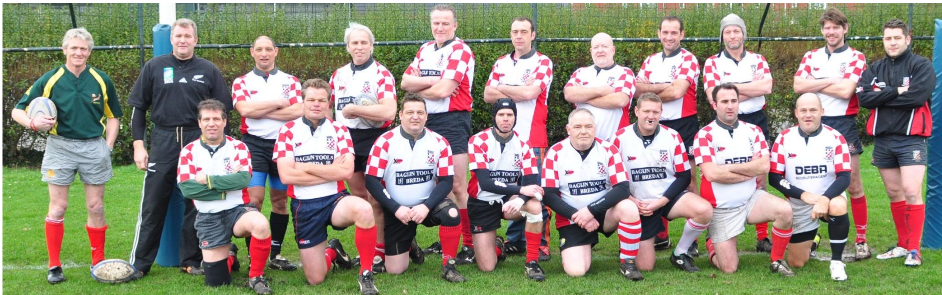
Het team van Oud