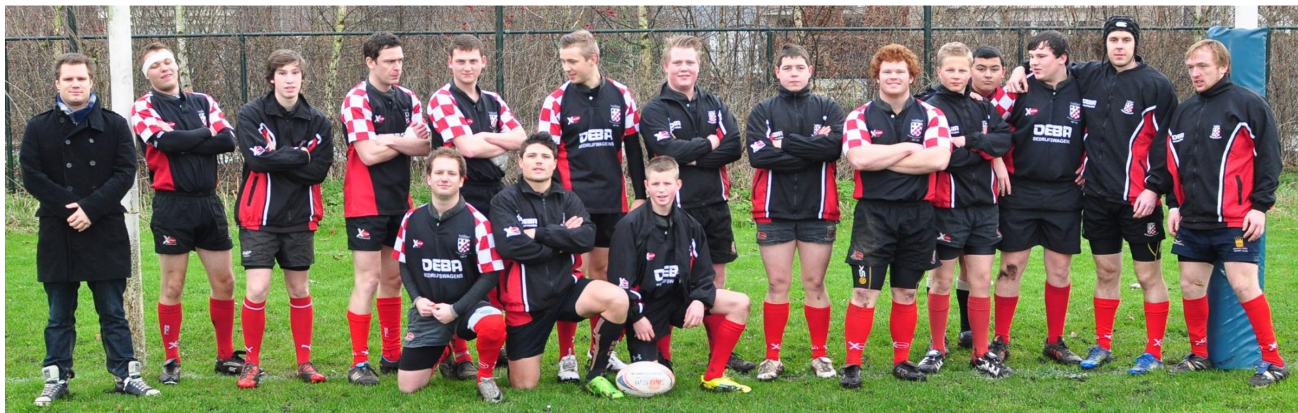
Het team van Jong